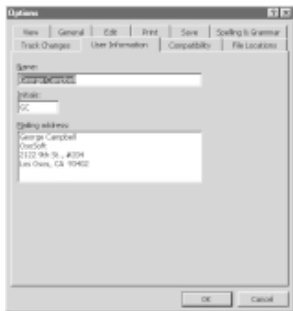
Hình 1: Thay đổi địa chỉ hồi âm đơn giản bằng cách chọn Tools.Options.

K hung hội thoại Envelopes and Labels trong Word 97 và 2000 (Tools. Envelopes and Labels) tự động điền địa chỉ hồi âm của bạn vào. Nhưng địa chỉ này được lấy từ đâu? Và nếu bạn