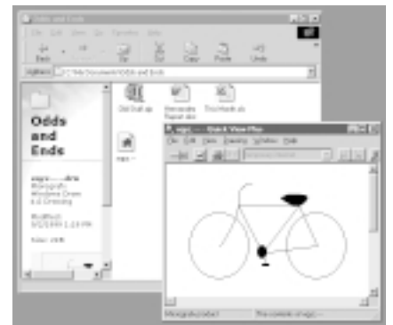
Hình 2: Nhấn đúp vào một file chưa được liên kết và mở chương trình xem file mà bạn thích.

Làm sao tôi có thể mở và xem những file chưa được tạo liên kết trong một chương trình nào đó (như Notepad chẳng hạn) bằng cách nhấn đúp vào chúng?